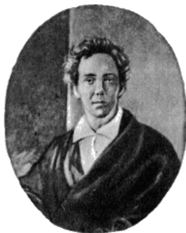
Антоний Погорельский (Алексей Алексеевич Перовский) (1787—1836)

Сказка-повесть о Чёрной курице была написана Алексеем Алексеевичем Перовским. Сказку