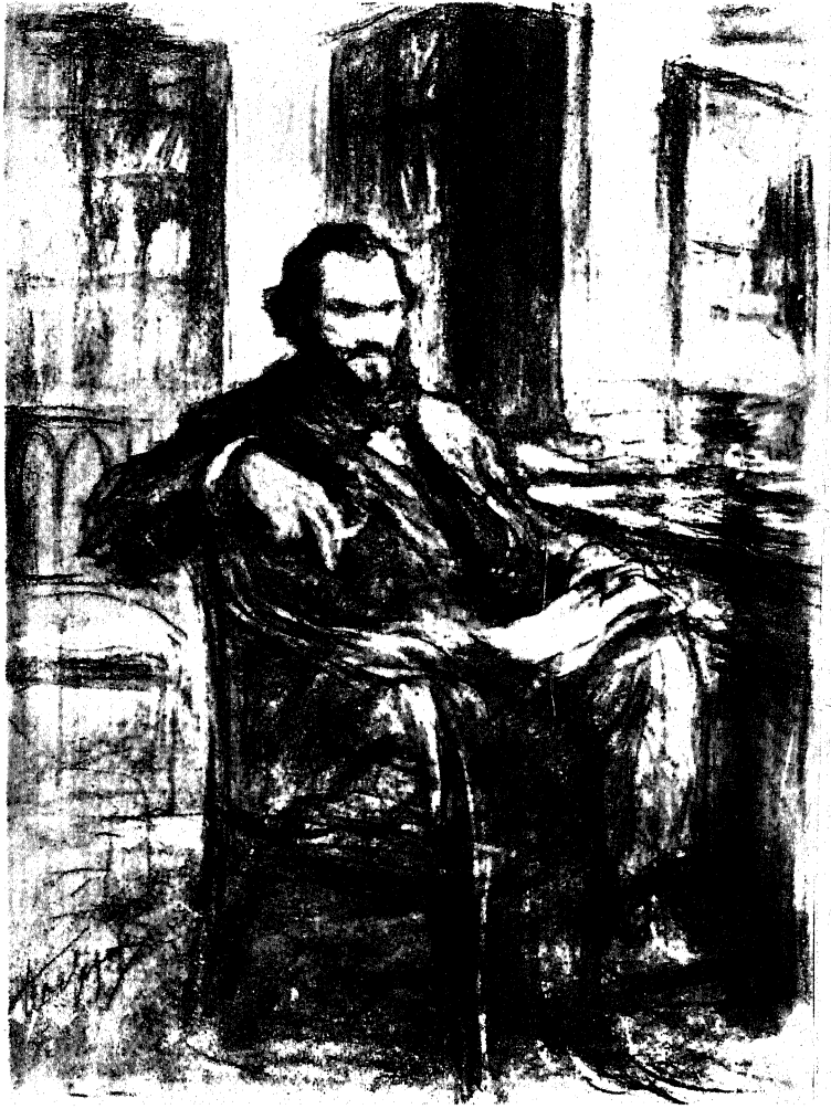
Л. Н. ТОЛСТОЙ в эпоху „Войны и мира“. С рисунка Л. О. Пастернака